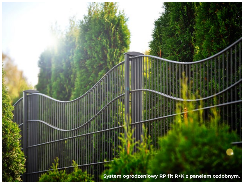
System ogrodzeniowy RP fit R+K z panelem ozdobnym.

gdy na naszą posesję będą chcieli się dostać niepożądani goście czy... dzika zwierzyna, z którą klasyczne ogrodzenie nie ma szans.